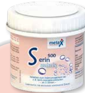
Serin 500 minis ab 3 Jahren