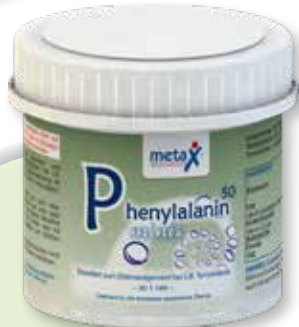
Phenylalanin 50 minis ab 1 Jahr