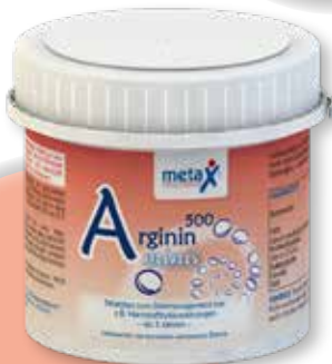
Arginin 500 minis ab 3 Jahren