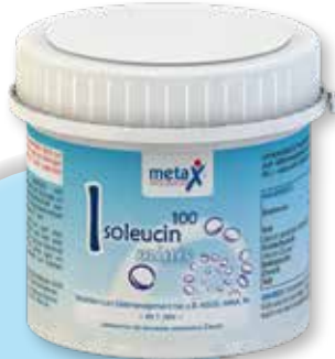
Isoleucin 100 minis ab 1 Jahr