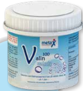
Valin 100 minis ab 1 Jahr