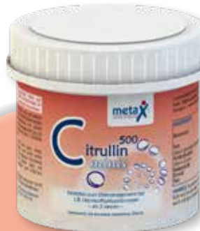
Citrullin 500 minis ab 3 Jahren